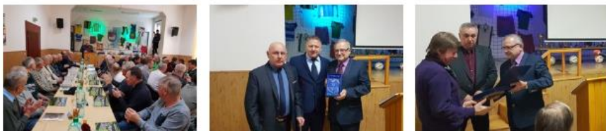
Jubileum futbalu v Podturni (5 fotografií)

PODTUREŇ. Popoludní bolo na priestranstve medzi obecným úradom a kultúrou nezvyčajne rušno. Desiatky pánov, ktorí sa medzi sebou veľmi srdečne vítali, mali, okrem lásky k futbalu, spoločný ešte jeden dôležitý atribút – hrávali ho v Podturni. Pre niektorých z prítomných to možno znelo až neuveriteľne, ale futbal v dedine medzi Liptovským Mikulášom a Liptovským Hrádkom oslávil (a skutočne veľmi dôstojne) 70. výročie založenia.