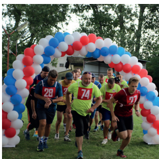
str. 05 PODTURNIANSKY BEH