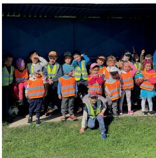
str. 02 ZO ŽIVOTA DETÍ Z NAŠEJ MŠ

ZO ŽIVOTA OBCE | UDALOSTI A AKTIVITY V OBCI | ŠPORT | CIRKEVNÉ OKIENKO | OZNAMY A INFORMÁCIE | INÉ