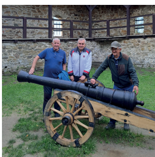
str. 08 VÝLET SENIOROV NA HRAD