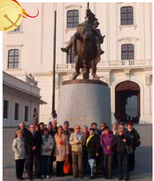
Výlet členov JD do Bratislavy