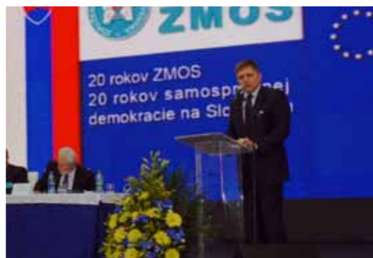
Pohľad na predsedníctvo ZMOS-u s hosťami a predseda vlády Róbert Fico sa prihovára účastníkom snemu