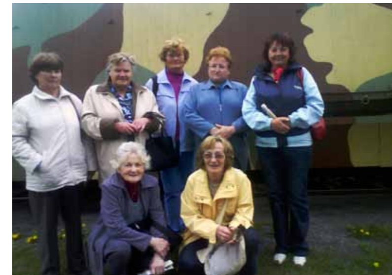
Zúčastňujú sa aj na športovo kultúrnych akciách...