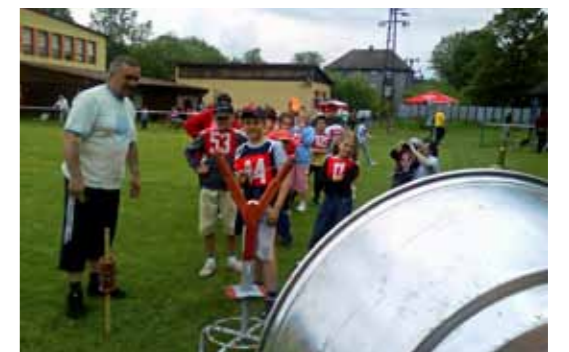
Pomôžu pri organizovaní športových hier počas MDD