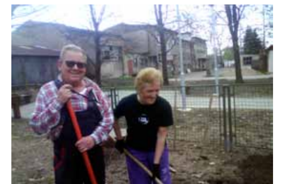
Pravidelne sa zúčastňujú brigád