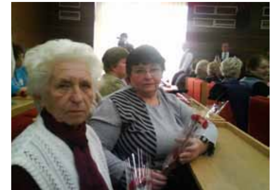
Naše členky boli pozvané na posedenie, ktoré organizoval okresný výbor pri príležitosti MDŽ