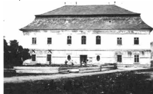
Pohľad na kaštieľ v prvej tretine 20. Storočia