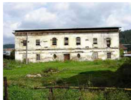
Pohľad na kaštieľ v súčasnosti

nákladnej prestavby tohto kaštieľa, postavil v Podturni aj ďalší kaštieľ, ktorý sa neskôr nazýval „Šimúnovský“.