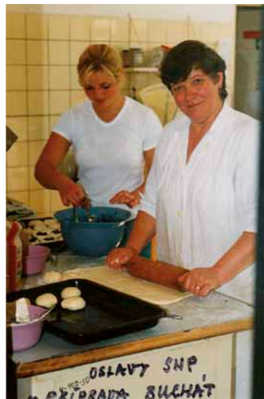
Oslavy SNP v začiatkoch – rok 2000 príprava buchiet na oslavy

„MACHINGVER“ mal munície dosť ale laufy (hlavne) sa pri obrovskej „SEČI“ vojsk tak rozpálili, že nestihali chladnúť! Zem bola posiatá vojakmi a krvou. HROZNÉ. Čo sa nám nevydarilo, v tom čase bola VYHLIADKOVÁ VEŽA vysoká 49m, z ktorej by bolo možné pozorovať SLOVENSKO – POLSKÚ časť Dukelského priesmyku a strategický plán Karpatsko-dukelskej operácie. Bola uzavretá.