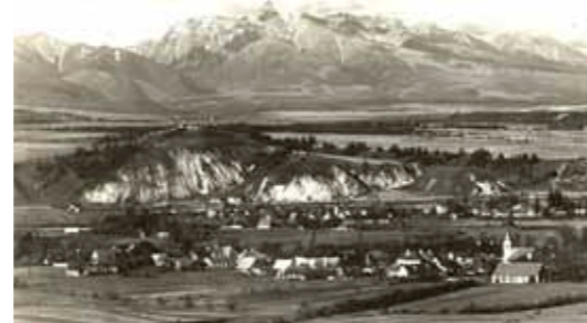
Pohľad na Vartu, Baštu a Velínok od Liptovského Jána v prvej tretine 20. Storočia